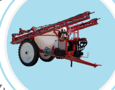
Pulvérisateur trainés - Préparation bouillie

Dans un pulvérisateur dont la cabine n'est pas équipée de filtre à charbon actif.