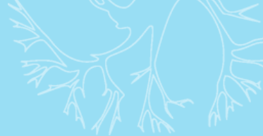
Pulvérisateur à dos - Préparation bouillie