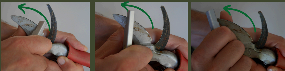
Le bon angle