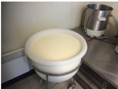
Diminution du port de charge