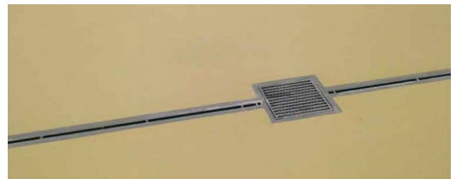
Choix du sol et des évacuations pour diminuer les chutes de plain pied