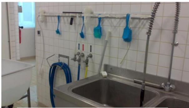
Aménagement du plan de travail

Une réflexion sera aussi menée, par exemple, autour des machines qui émettent du bruit (positionnement dans le local, choix de la machine), du choix et du positionnement de l'éclairage, du choix des sols car de nombreux accidents du travail sont dus aux chutes de plain pied.