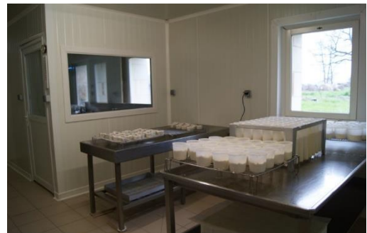
Positionnement des ouvertures pour améliorer les conditions de travail