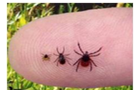
Différentes tailles de tiques

En moyenne, 15 % des tiques sont infectées (avec une variabilité régionale allant de 0 à 50%).