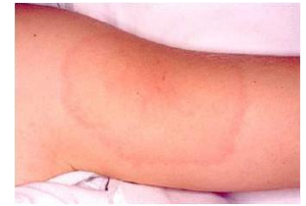
Erythème migrant sur un bras

L'érythème migrant, caractéristique de la maladie, survient de 3 jours à 1 mois après la morsure de tique (10 cm de diamètre en moyenne allant jusqu'à 70 cm). Il est présent dans 63% des cas. Sa disparition ne signifie pas la guérison.