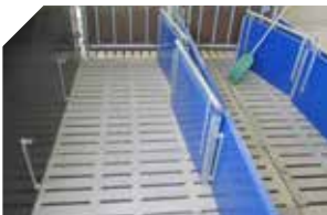
Portillons en position ouverte

→ Un passage à côté de la balance doit permettre à une seule personne de s'occuper de la pesée et du déplacement des animaux.