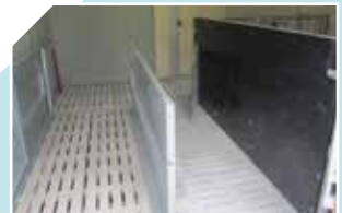
Passage sur la balance pour la pesée